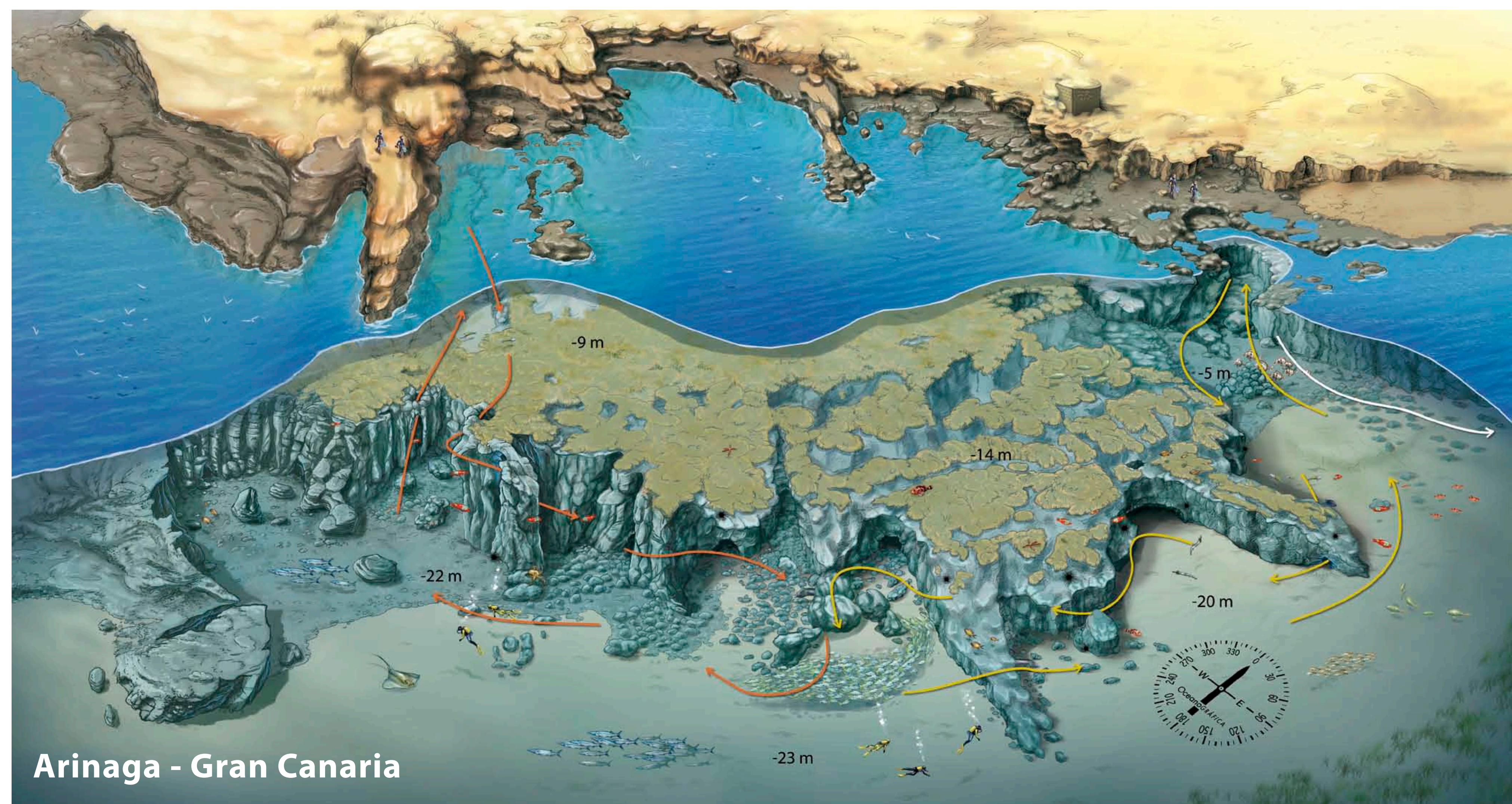
Arinaga - Gran Canaria

La declaración de una red de MAMPs impulsaría en este Archipiélago el turismo sostenible, que genera a su vez calidad, y además, propiciaría el desarrollo socioeconómico de muchos otros sectores de la isla, actualmente en segundo plano por el modelo turístico existente de "sol y playa", favoreciendo asimismo una diversificación de la economía de las islas.